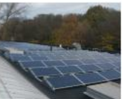
Menuiserie Rigobert SA Régionalisering