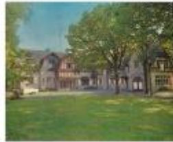
Ecole Plein Air à Uccle Régionalisering