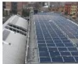
Commune de Molenbeek Régionalisering