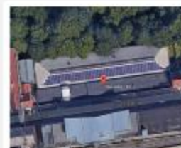
Commune de Jette Régionalisering