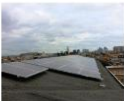
Ecole Van Helmont à Jette Régionalisering