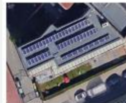
Crèche Reine Fabiola Jette Régionalisering