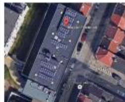
Commune de Jette Régionalisering