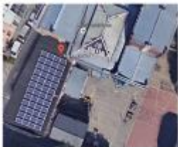
Ecole 10 à Molenbeek Régionalisering