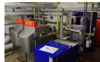
ACP HUYSMANS Ketelhuis en WKK