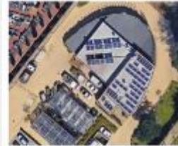
Commune de Molenbeek Régionalisering