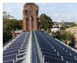
Ecole Brel à Jette Régionalisering