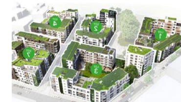
TIVOLI GREEN CITY Ketelhuis, warmtenet, WKK, PV