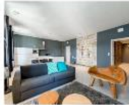
Smartflats Bruxelles Régionalisering