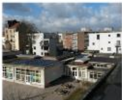
Ecole 5 à Molenbeek Régionalisering