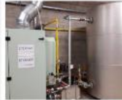
Basilique de Koekelberg Cogénération