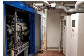
ACP MARIUS RENARD cogénération, isolation toiture